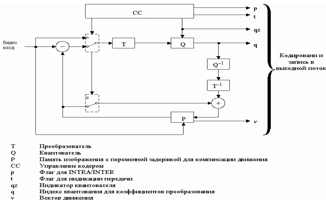
Рис.1 Структурная схема кодера

Кодеки H.263 полностью совместимы с кодеками H.261 и H.262, при этом обеспечивают дополнительные функции, значительно улучшающие характеристики обработки видеоданных.